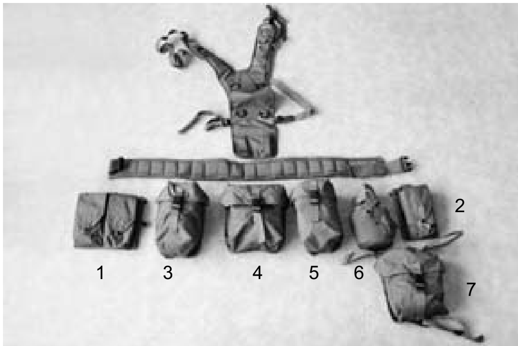
Pilt 2.1 Vöörihm, traksid ja rakmed