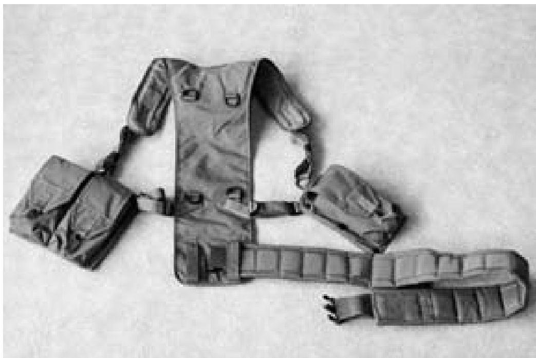
Pilt 2.2 Traksid

1. Rakmete rihtm pange läbi traksid alumise parem-poolse aasa.